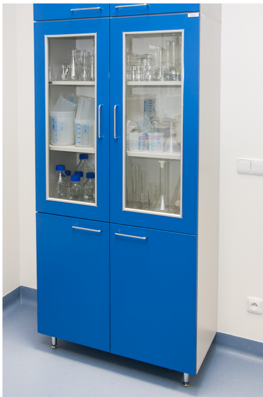
Obrázek 4 - Referenční prosklená laboratorní skříň

Doporučené barevné provedení: kovové části RAL 7035 světle šedá, deska světle šedá, lamino světle šedé, dveře a čela modrá, vč. hran.