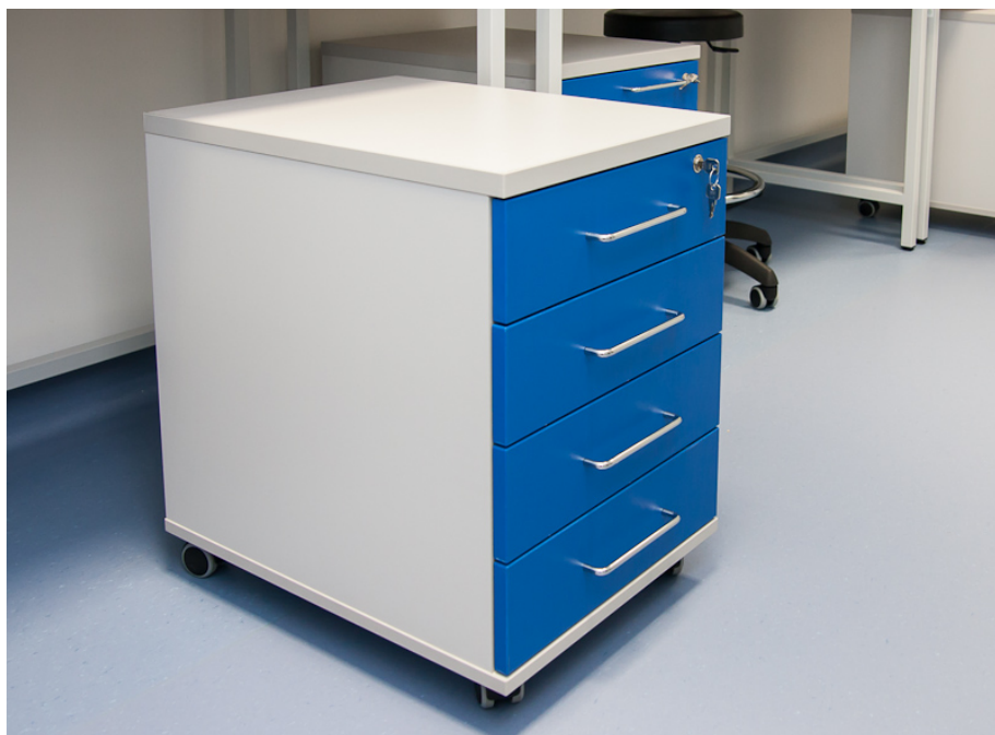
Obrázek 3 - Referenční kontejner (na fotografii menší velikost se 4 zásuvkami)