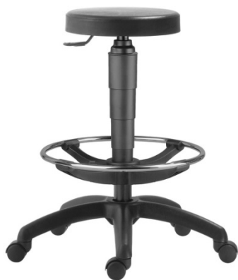
Obrázek 6 - Referenční laboratorní sedák