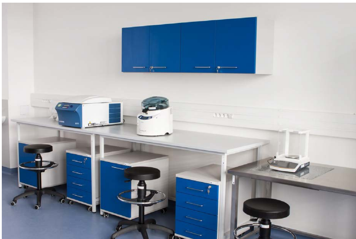
Obrázek 1 - vzhled stávajících laboratoří