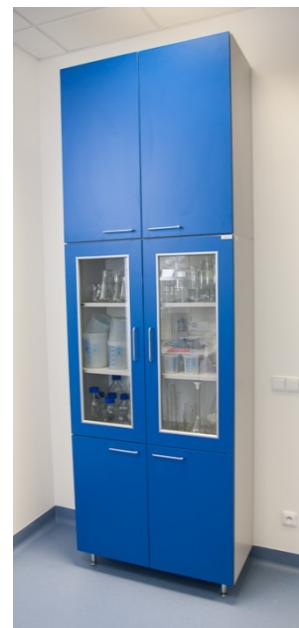
Obrázek 5 - Referenční nástavec na prosklené laboratorní skříni

Limitní je celková výška sestavy, která nesmí přesáhnout 2850 mm – výška pohledu.