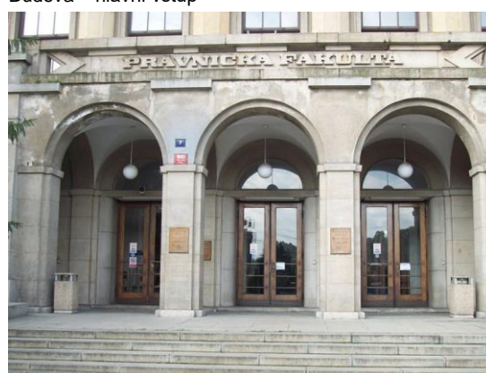
Budova – hlavní vstup