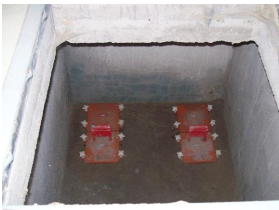
Protipovodňové klapky ve II. suterénu