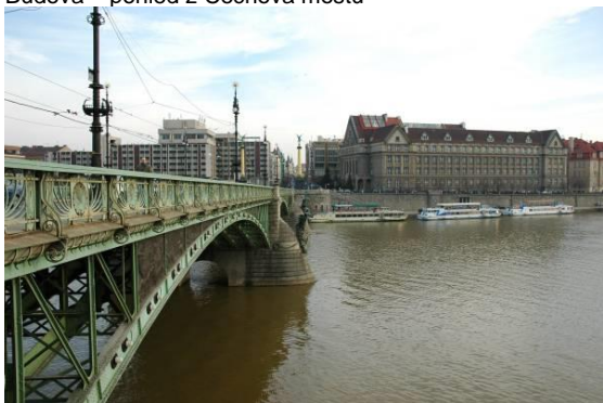
Budova – pohled z Čechova mostu