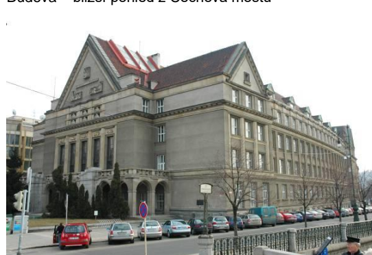
Budova – bližší pohled z Čechova mostu