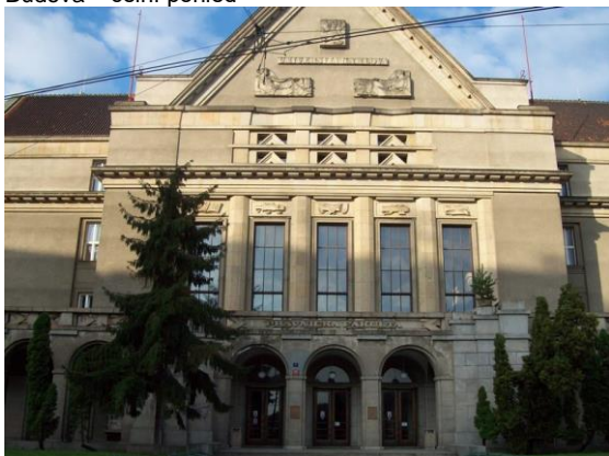
Budova – čelní pohled