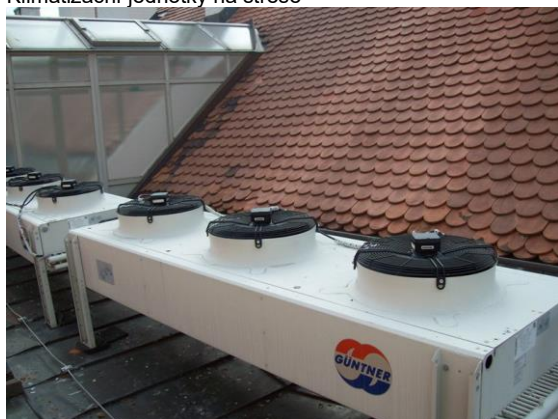
Klimatizační jednotky na střeše