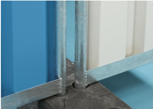
ULOŽENÍ NA ZÁKLAD